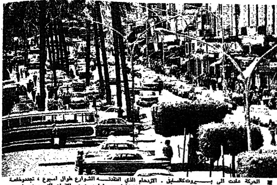
الحركة عادت الى طبيعتها الشوارع طوال اسبوع ، تجدوا عند مخرج العمدة امس . وكذلك السواق استعادت نشاطها بعد طول جوع ، والجران التي عجزت في فترة العودات عن تلبية حاجات المواطنين . وفي الصورة الاولى الى اليمين تبدو سيدتان تخرقان «البروك» وسط الشارع في محطة الزبينة بمساحات الحصول على الخبز . وفي الصورة الثانية تبدو ساحة الشهداء وقد استعادت حركتها .